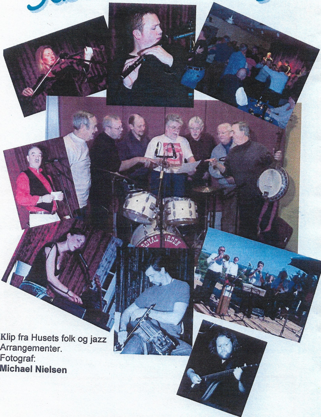
Klip fra Husets folk og jazz Arrangementer.